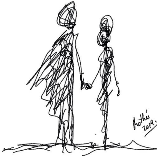
Garabato 7: Estoy aquí (Mothe 2019)