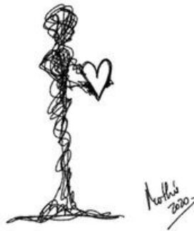
Garabato 5: Mi corazón en tus manos 1 (Mothú 2020)