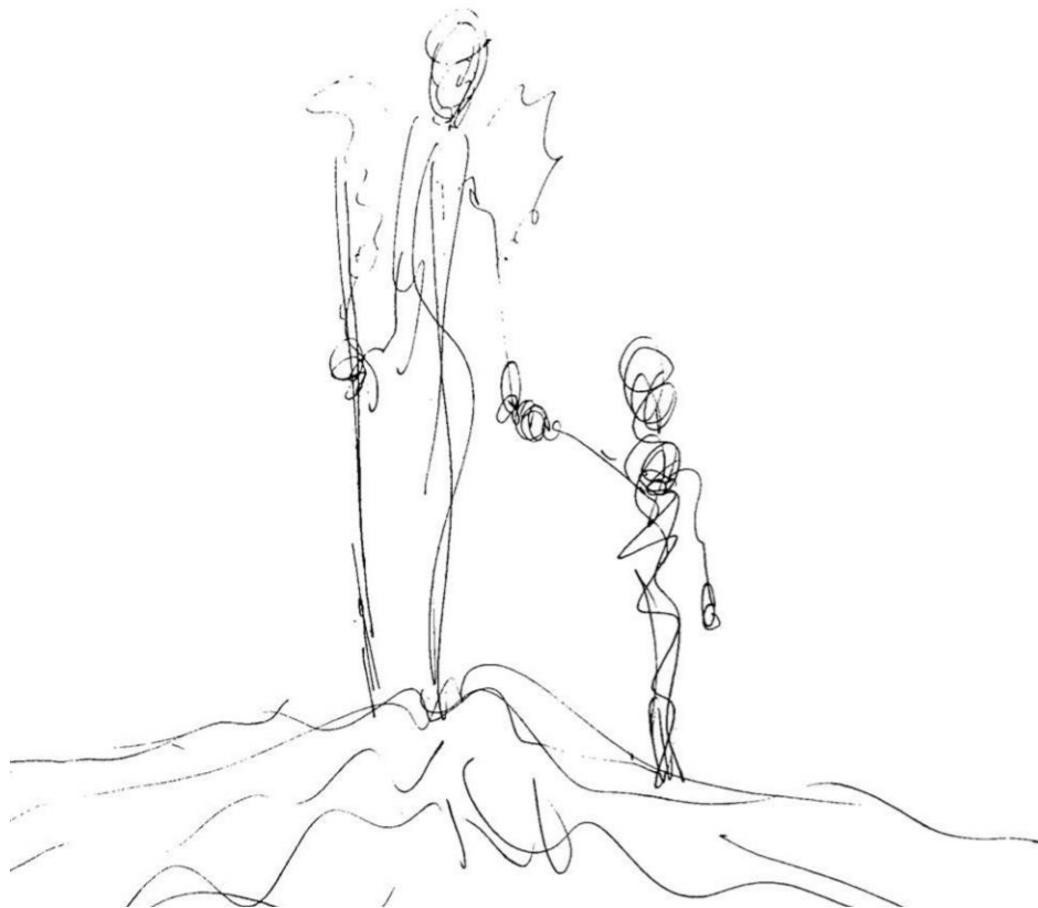
Garabato 1: Siempre contigo (Mothú 2019)

(Pautas elaboradas por profesionales especialistas en duelo y pérdidas)