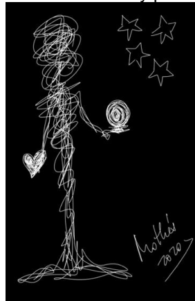
Garabato 9: Luz (Mothú 2020)