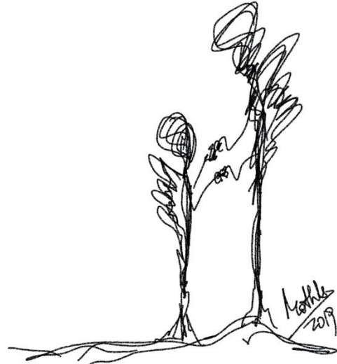
Garabato 6: Con tus alas (Mothú 2019)

"Nunca he visto niños dañados por la exposición a la muerte, lo que sí he visto son niños dañados por la ansiedad de los supervivientes".