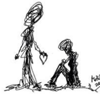
Garabato 10: No te rindas (Mothú 2020)