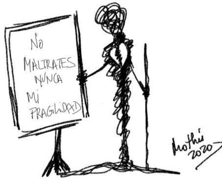
Garabato 5: No maltrates nunca mi fragilidad (MoThú 2020)

A veces somos nosotros los que no podemos hablar con la persona en duelo o tenemos miedo a hacerle daño y/o nos cuesta sostener su dolor. Cuando seas capaz de hablar con la persona, practica una escucha activa y empática , facilita su desahogo, dejándole expresar cómo se siente y las cosas que echa de menos de su familiar. Evita usar frases hechas , que lo único que hacen es minimizar el dolor.