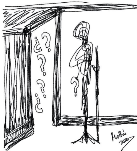
Garabato 2: Incertidumbre (Mothú 2020)

Por este motivo, esta pequeña red de psicólogas, trabajadoras sociales, enfermeras y terapeutas especializadas en pérdida y duelo hemos elaborado una serie de consejos que esperamos puedan ayudar a sobrellevar estos momentos tan difíciles de aislamiento e incertidumbre, ofreciendo otras formas que suplan esta necesidad de compartir y expresar el dolor con los demás y que al mismo tiempo nos permitan honrar la memoria de nuestros seres queridos fallecidos.