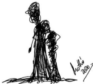
Garabato 3: Descansa en mi hombro (Mothú 2020)

Así mismo, las compañías funerarias están ofreciendo servicios de asesoramiento y acompañamiento psicológico a sus clientes. Infórmate sobre este servicio, puede ser de gran ayuda para estos momentos.