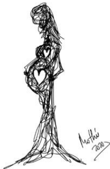
Garabato 8: La espera (Mothú 2020)

Repite esta acción dos veces. A continuación, respira doblando los tiempos: inspira contando hasta dos y expira contando hasta 4, después, volvemos a doblar los tiempos, inspira contando hasta 3 y expira contando hasta 6. Llega hasta donde seas capaz y entonces céntrate en la parte del cuerpo que más sientas, quédate en esa sensación y descríbela con una palabra. Por último, asocia esta palabra, una imagen relajante a la sensación de alivio que has tenido y recupérala cuando te veas desbordada.